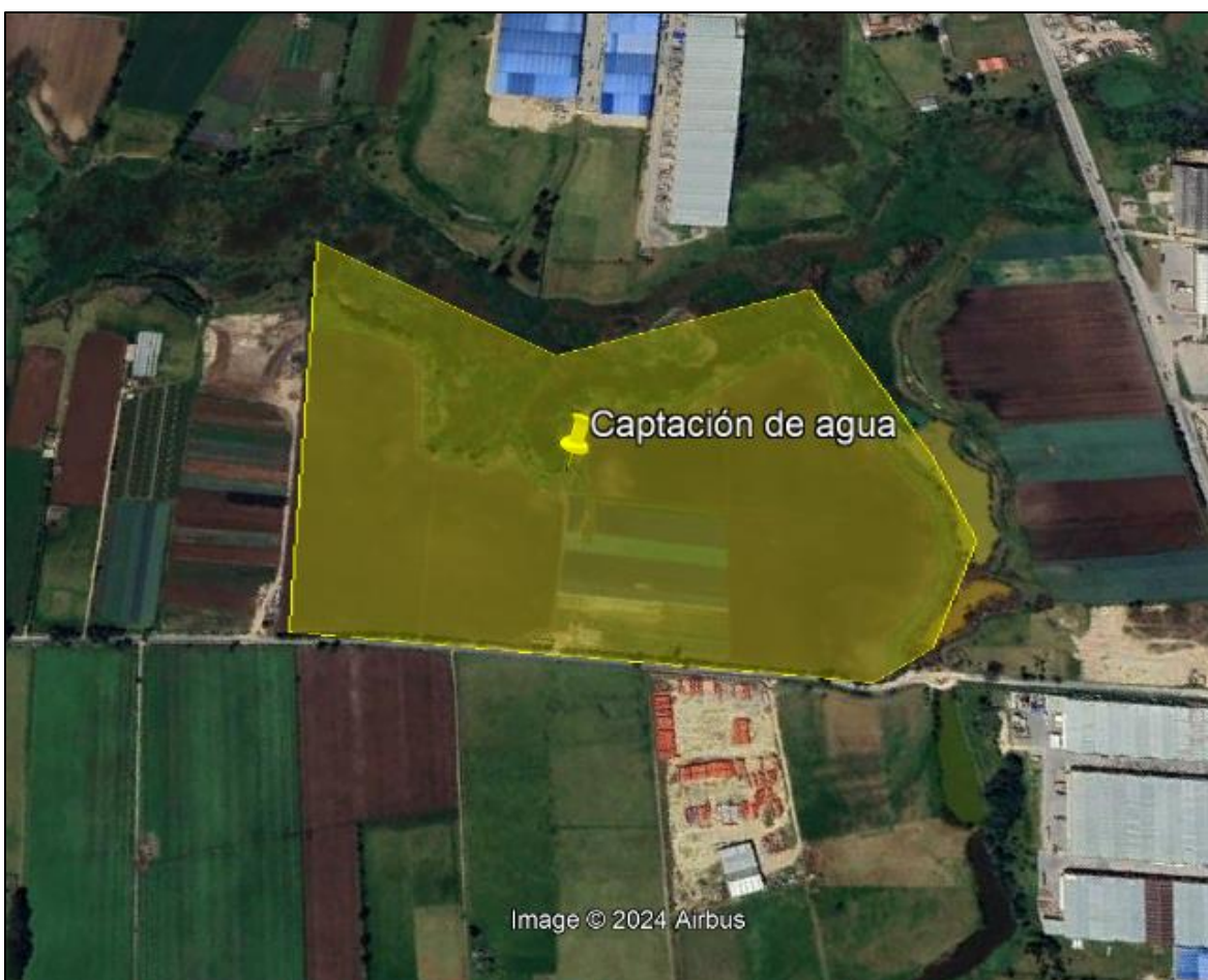
Ilustración 1. Recorrido

El día 02 de agosto de 2024, se realizó recorrido de control y vigilancia en la ronda del humedal Gualí, ecosistema que fue declarado por la Corporación Autónoma Regional de Cundinamarca - CAR como Distrito Regional de Manejo Integrado a través del acuerdo 001 de 2014 "Por medio del cual se declaran como Distrito Regional de Manejo Integrado (DMI), los terrenos comprendidos por los humedales de Gualí, Tres Esquinas y Lagunas de Funzhé, y su área de influencia directa ubicada en los municipios de Funza, Mosquera y Tenjo, Cundinamarca", y estableció tres zonas: 1. Preservación (espejo de agua), 2. Recuperación (50 metros) y 3. Uso sostenible (100 metros), con el fin de identificar presuntas afectaciones ambientales. Dentro del recorrido se identificó una captación de agua superficial en el Humedal Gualí en el predio denominado "Lote A" conocido como "Gualí" (Ilustración 1. polígono amarillo), ubicado en la vereda El Hato, coordenadas 4°43'25,224" N-74°11'16,692" W, como se muestra en la siguiente ilustración: