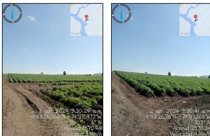
Ilustración 3. Actividad agrícola

En el predio se realizan actividades agrícolas, como se observa en las siguientes ilustraciones: