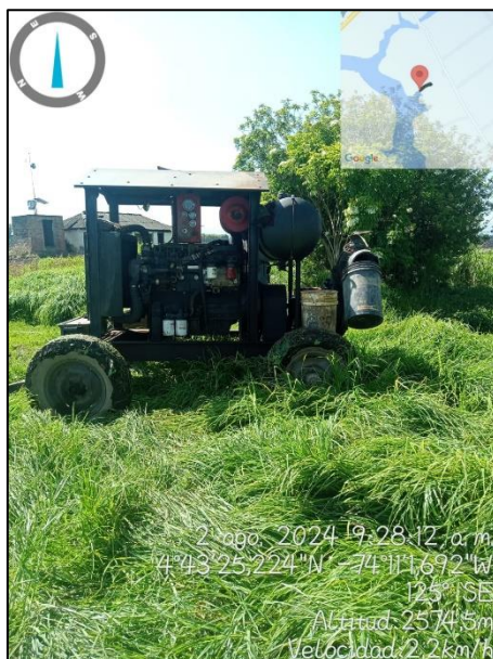
Ilustración 5. Motobomba en la ronda de Humedal

C.P. 250020 Tel. +57(1) 823 40 70 823 40 71 / 823 40 73 Fax. + 57(1) 825 76 20 Dir. Cra. 14 No. 13-05